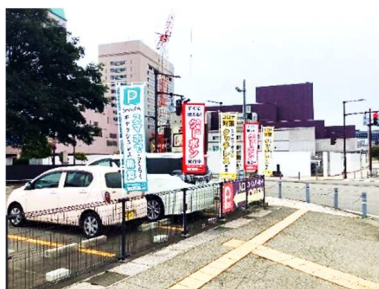
コインパーキング(「SmooPA」のアイコンが目印)

「SmooPA」は、コインパーキングでの駐車料金を、リモート決済できるスマートフォン向けアプリです。決済の他、目的地周辺の駐車場検索や、目的地までのルート検索・ナビゲーション機能を備えております。また、リアルタイムで駐車場の空き情報を確認でき、ストレスなく駐車場をご利用いただくことが可能です。