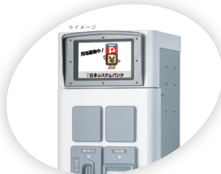
動画再生により 貴社の広告宣伝が可能 (対応予定)