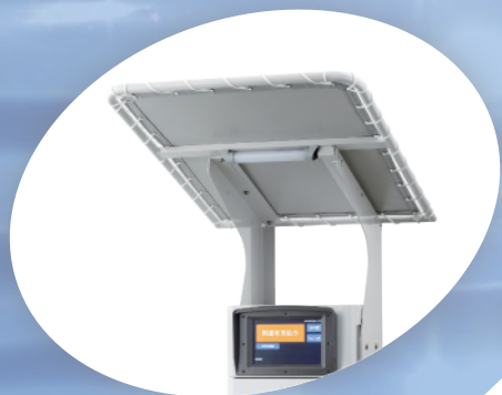
一体型幅大テント ※幅小タイプもございます