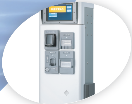
キャッシュレス決済機/磁気カードリーダー